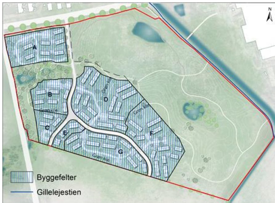
Illustrationstegning over planområdet med byggefelter.

Herudover er der reserveret arealer til spredningskorridorer for den spidssnude frø, hvor der ikke kan opføres nogen form for bebyggelse eller anlæg, udover til regnvandshåndtering. Inden for spredningskorridoren i delområde 1, er der desuden to §3-naturbeskyttede søer.