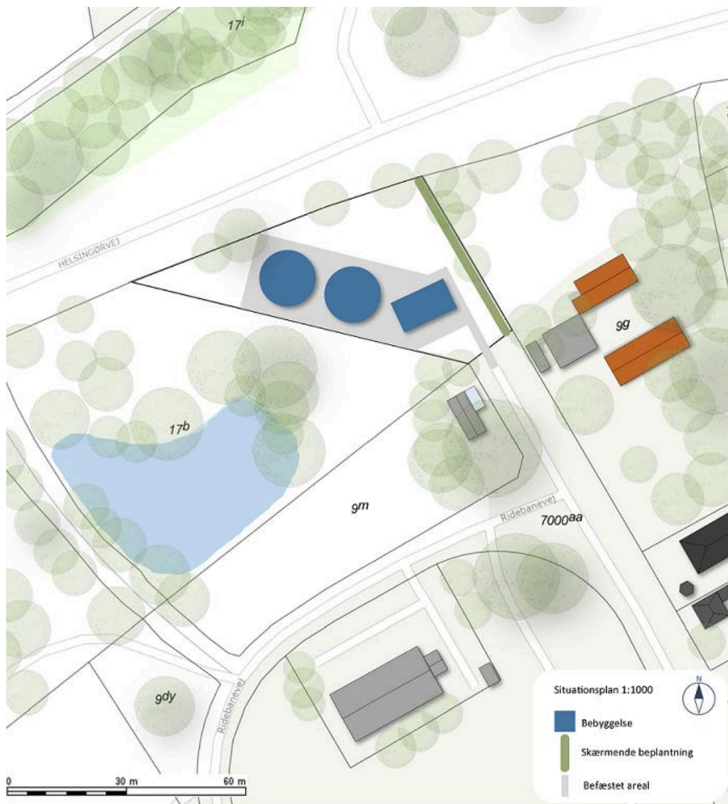
Situationsplan, der viser placering af teknikbygning samt de to akkumuleringstanke.