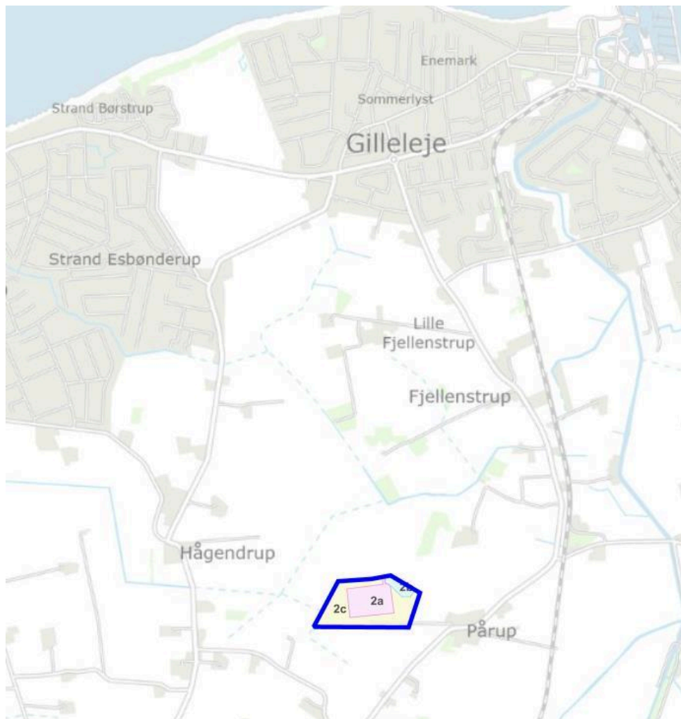
Placering af arealreservation ved Pårup