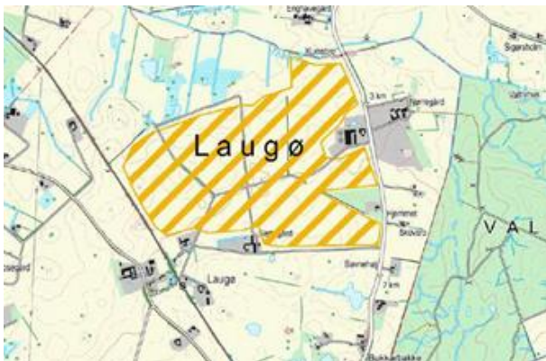
Kortet viser forslag til nyt interesseområde ved Laugø