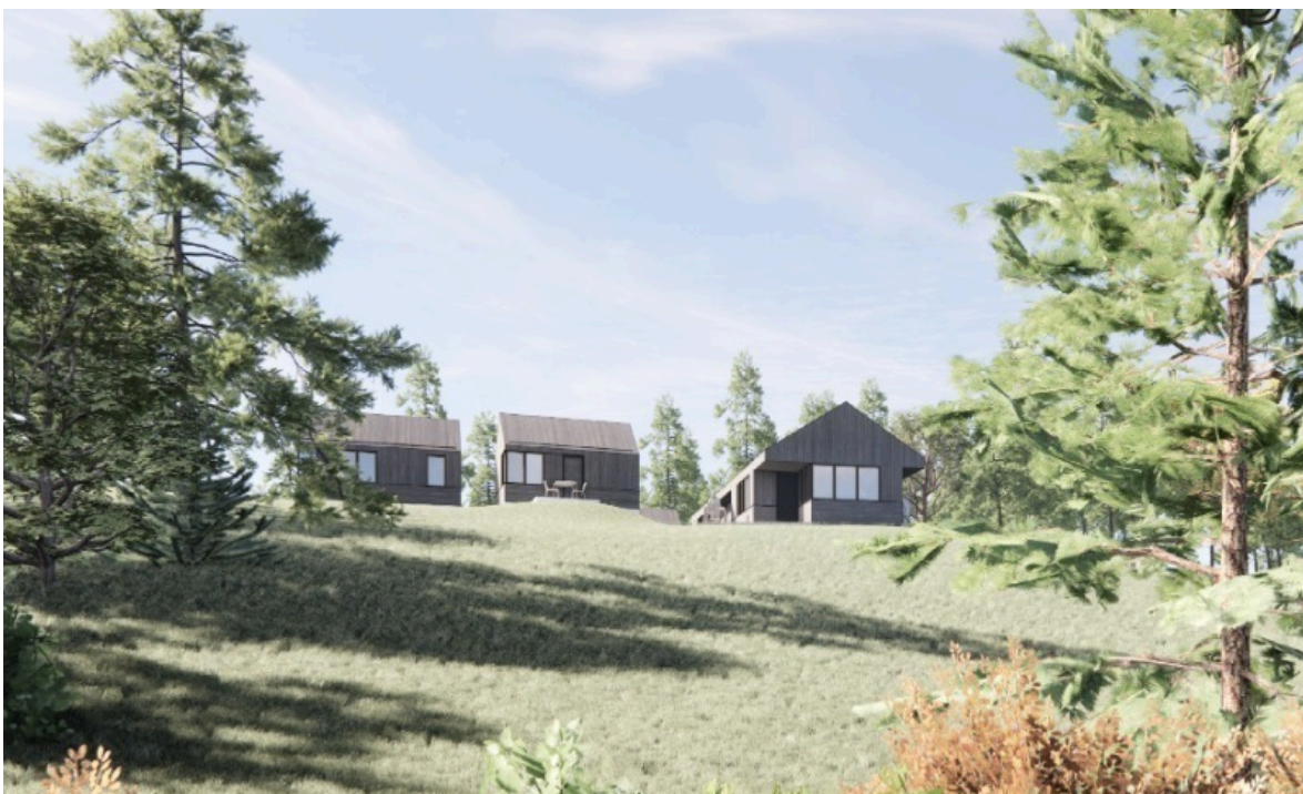
Foreslåede nye forhold, set fra øst