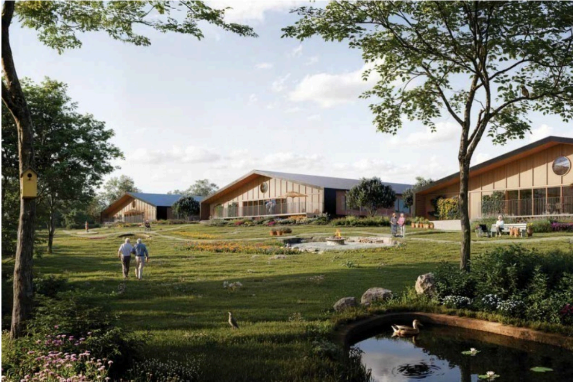
Illustration med visualisering af de 3 bygninger set fra vest fra det fælles have anlæg.