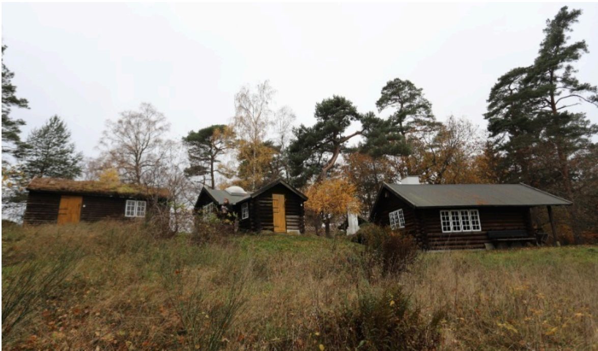
Eksisterende forhold, set fra Øst

Rådgiver argumenterer for, at kulturværdierne i Tibirke Bakker primært knytter sig til landskabet og huse indpasning heri – værdier, som det nye projekt netop tilgodeser ved at bygge bæredygtigt og inden for det eksisterende fodaftryk. Det anføres desuden, at ejendommen er beliggende i et privat område uden offentlig adgang.