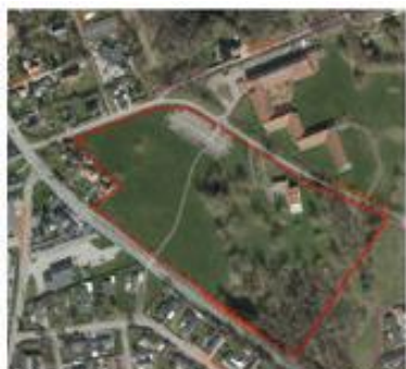
2 Luftfoto med lokalplanens afgrænsning

Området udgør i dag de grønne arealer, der ligger i tilknytning til Bymose Hegn Hotel og Kursuscenter, beliggende mellem Frederiksborgvej og den nordvestlige ende af Bymosegårdsvej – omfattende matrikelnumrene 11a, 8mu og 11bu, Helsingørskommune.