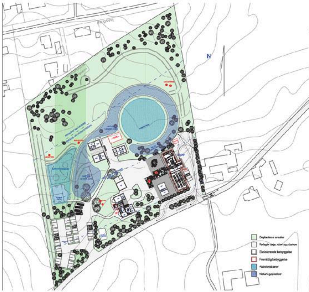
Nedenfor ses udsnit af kortbilag med planområde, delområder, byggefeltet, vejudlæg og -adgang, parkeringsareal samt sø.