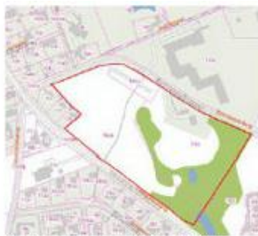
1 Lokalplanens afgrænsning